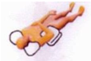
Slapen op de rug

Slapen mag op de rug en op de niet-geopereerde schouder. Gewone kussens kunt u gebruiken om het u gemakkelijk te maken (veren kussens werken het best). Een klein opgevouwen kussen onder de nek geeft voldoende steun aan uw hoofd. Een tweede opgevouwen kussen kunt u onder de arm van de geopereerde schouder leggen. Een derde opgevouwen kussen achter de rug, voorkomt dat u op de geopereerde schouder gaat liggen.