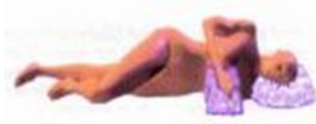
Slapen op de zij