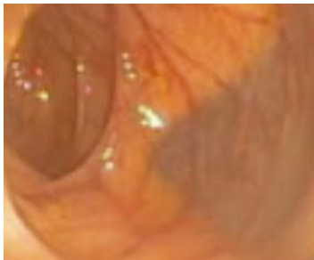
schone darm= goed zicht

Het is belangrijk dat de darm goed schoon is zodat het slijmvlies grondig kan worden onderzocht en zelfs de kleinste afwijkingen in het weefsel worden gezien. Wanneer de dikke darm van binnen nog verontreinigd is, is het zicht in de darm slecht en bemoeilijkt dit het onderzoek. Ook kan de arts belangrijke zaken, waaronder poliepen en zelfs kanker, missen. De arts of verpleegkundig endoscopist kan dan beslissen, na betere darmreiniging het onderzoek opnieuw te doen.