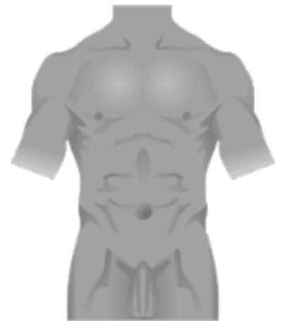
Hier kan de chirurg de plaats van de sneetjes aangeven

Tegenwoordig kan bij sommige van deze breuken de operatie met een laparoscoop worden uitgevoerd. Dit houdt in dat de arts een videocamera en speciale instrumenten gebruikt om de breuk te sluiten zonder een grote snee in de buik te maken. In plaats daarvan zijn slechts enkele kleine sneetjes nodig. Een laparoscoop is een lange rechte buis waarop een kleine videocamera is gemonteerd en een lichtbron. Voordat de laparoscoop in de buikholte wordt gebracht wordt de buikholte opgevuld met kooldioxide. Dit is een onschuldig gas dat aan het eind van de ingreep weer uit de buik verdwijnt. Dit is nodig om een goed overzicht te verkrijgen. De kooldioxide kan het middenrif prikkelen. Dit trekt via een zenuwbaan door naar de schouder. Na de operatie kan uw schouder even gevoelig zijn. Dit verdwijnt meestal vanzelf en u hoeft zich daar geen zorgen over te maken. Het kan voorkomen dat de arts tijdens de operatie vaststelt dat het niet (veilig) mogelijk is de breuk door middel van de laparoscopische ingreep op te heffen. Dan is het nodig om de breuk met een grotere snede 'open' te behandelen.