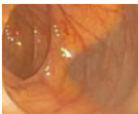
schone darm= goed zicht

Het is belangrijk dat de darm goed schoon is zodat het slijmvlies grondig kan worden onderzocht en zelfs de kleinste afwijkingen in het weefsel worden gezien. Wanneer de dikke darm van binnen nog verontreinigd is, is het zicht in de darm slecht en bemoeilijkt dit het onderzoek. Ook kan de arts belangrijke zaken, waaronder poliepen en zelfs kanker, missen. De arts kan dan beslissen, na betere darmreiniging het onderzoek opnieuw te doen.