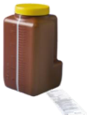
Urine bokaal 3 liter

Bij het ophalen van de bokaal heeft u meegekregen: