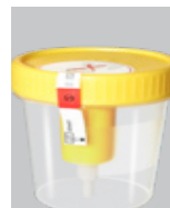
Het zakje bevat: Urinepotje, etiket en Instructieblad.