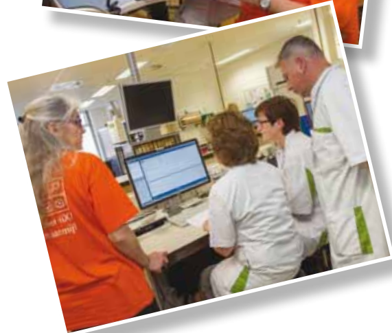
Op vrijdag 6 november ging het EPD 'live'. Een drukke en spannende dag voor het Elkerliek.